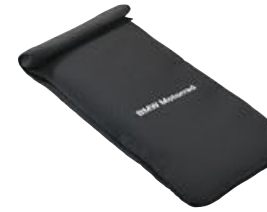
8 Akıllı telefon için çanta