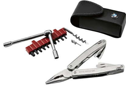
4 Çok işlevli alet