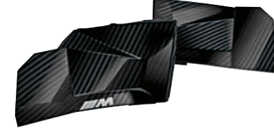
7 M karbon iç sürücü bölümü döşemesi