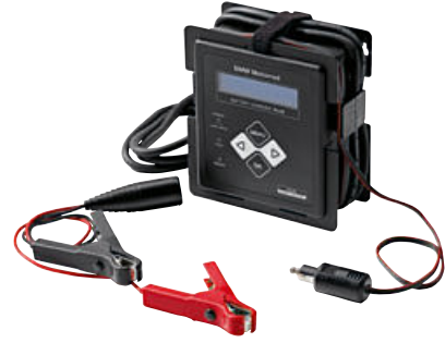
3 BMW Motorrad Plus akü şarj cihazı