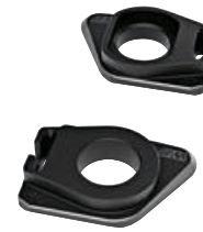
9 M zincir gergisi