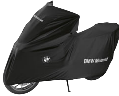
2 İç mekan motosiklet örtüsü