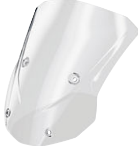
4 Yüksek ön cam