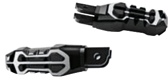
3 M sürücü ayak dayama yerleri