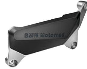
2 M motor koruması, sol