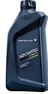
6 Orijinal BMW Motor Yağı ADVANTEC Ultimate 5W-40, 1 l