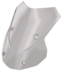
3 Renkli ön cam