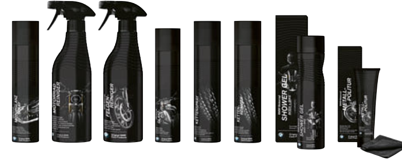
8 Original BMW Care Products