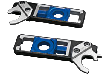
10 Montaj standı yuvası olan M zincir gergisi