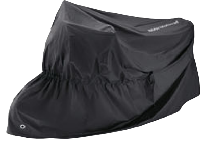
1 Motosiklet örtüsü