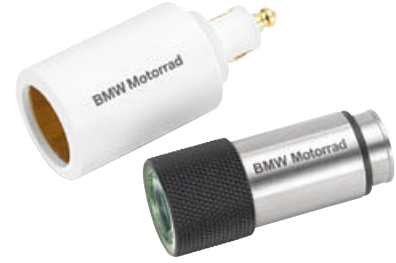
4 LED el feneri