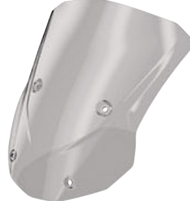
5 Yüksek ön cam, renkli