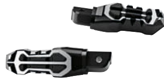
4 M arka ayak dayama yerleri