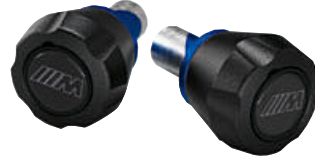
1 M aks koruyucuları