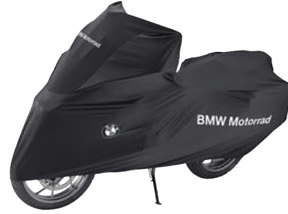
3 İç mekan motosiklet örtüsü, büyük