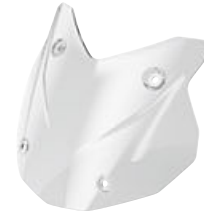
7 Alçak ön cam, renkli