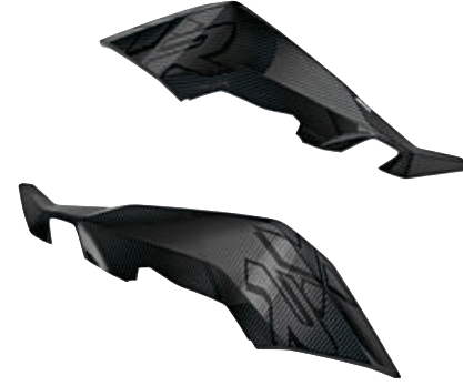
6 M karbon yan döşemesi