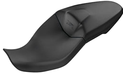
2 Alçak sele