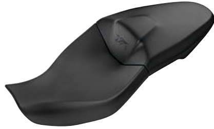
1 Yüksek sele