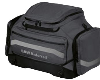
3 Büyük yumuşak çanta