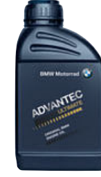
7 Orijinal BMW Motor Yağı ADVANTEC Ultimate 5W-40, 500 ml