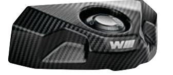
8 M karbon kontak kilidi kapağı