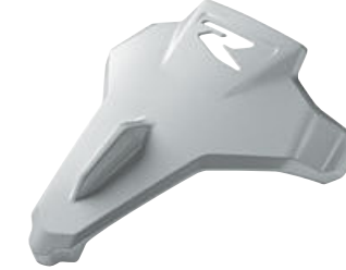
9 Hockenheim metalik gümüş yolcu selesi kılıfı