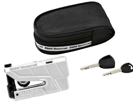
2 Hırsızlık alarm sistemi ile fren diskli kilidi