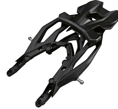
6 Bagaj taşıyıcı