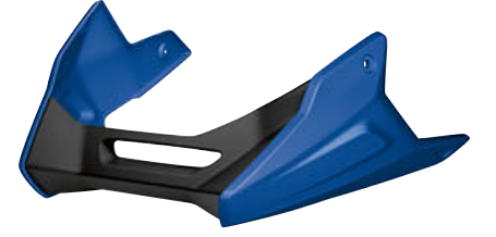
8 San Marino metalik mavi motor spoyleri