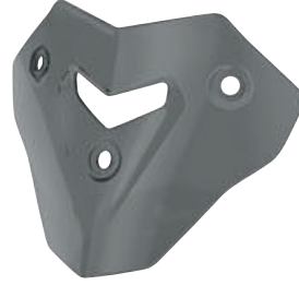
2 Şeffaf ön cam