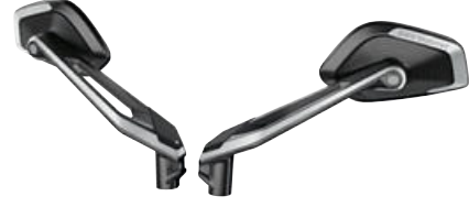
1 HP aynalar