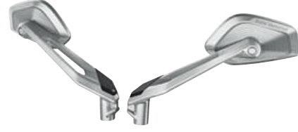
2 Option 719 gümüş aynalar