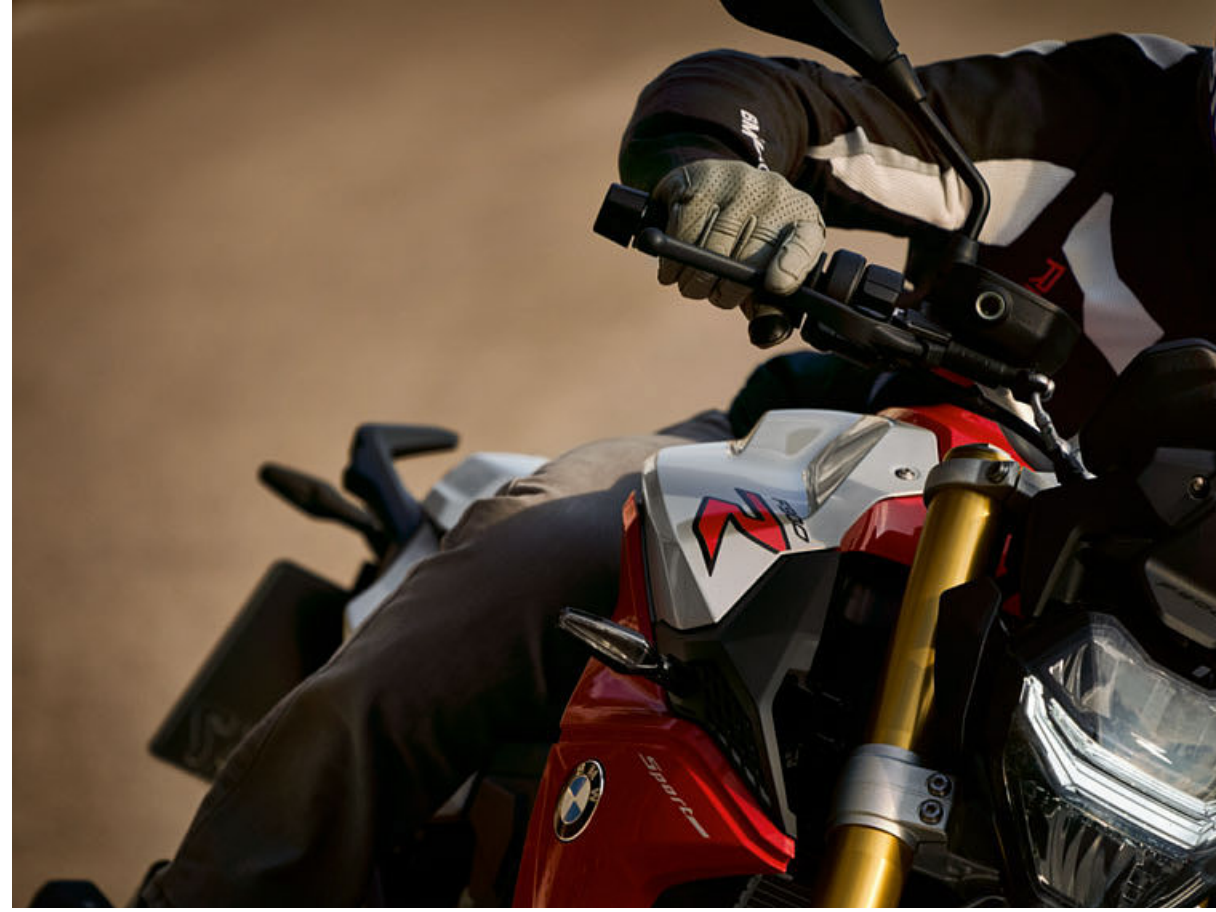
4 Comfort sele