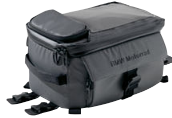
2 Küçük depo çantası