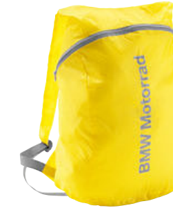
9 Katlanır sırt çantası