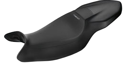
5 Yüksek sele