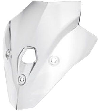
1 Yüksek ön cam