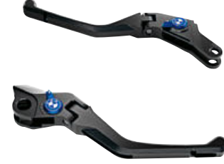
3 Katlanır fren kolu Katlanır debriyaj kolu