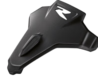
10 Storm metalik siyah yolcu selesi kılıfı