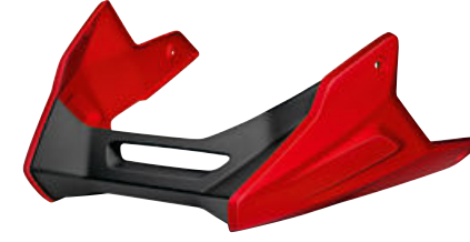
6 Motor spoyleri, Racing kırmızısı