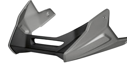
7 Motor spoyleri, Granit mat metalik gri