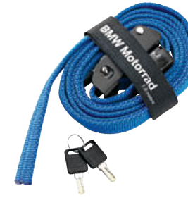
6 Atacama rulo çanta için germe bandı, kilitlenebilir