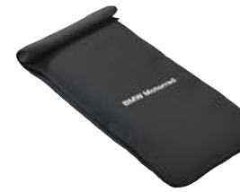
8 Akıllı telefon için çanta