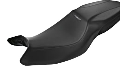
4 Comfort sele