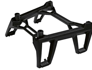
2 Yumuşak çanta tutucu