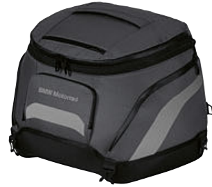
4 Küçük yumuşak çanta