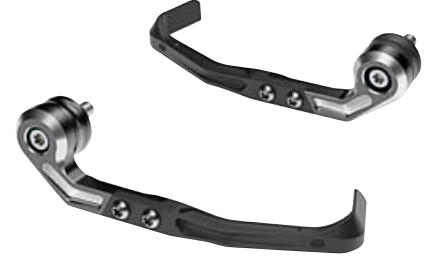
4 El freni kolu koruyucusu Debriyaj kolu koruyucusu