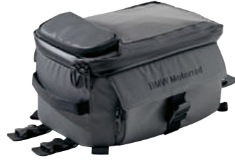
2 Küçük depo çantası