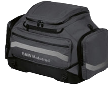
3 Büyük yumuşak çanta