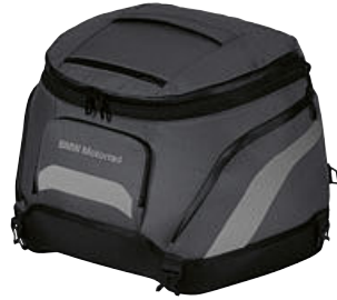
4 Küçük yumuşak çanta