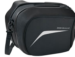
2 Sol touring yan çanta için astar