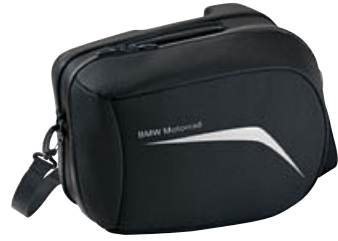
3 Sağ touring yan çanta için astar