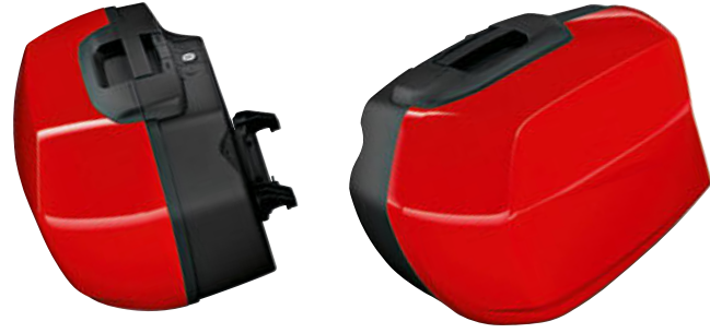
1 Touring yan çanta