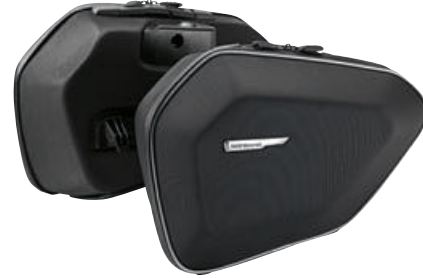
4 Yumuşak çanta