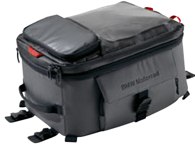
1 Büyük depo çantası