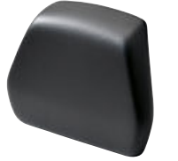
7 Küçük arka çanta için sırt dayama minderi